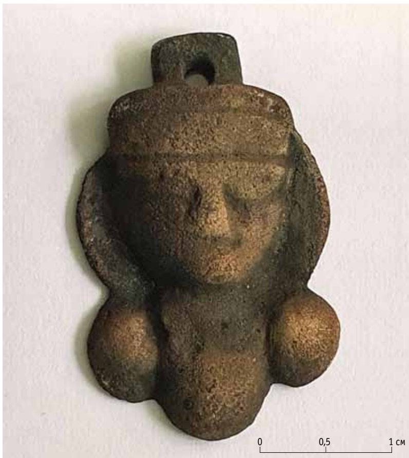
Фото 1. Бронзовая буддийская подвеска-оберег. Случайная находка на городище Актобе

Бронзовая подвеска (Фото 1, Рис. 1), вылитая в цельной форме, размеры: 3,2 × 2,1 см, толщина 0,4 см (ширина – по изображению нимба – наиболее широкой части подвески). Скульптурное изображение мелкой пластики представляет собой изображение мужского лица, монголоидного типа; его общий округлый контур мягко моделирован, тонко проработаны нос и брови, глаза слегка наклонены вниз внутренними углами, достаточно высоко подняты брови, плавно спасающиеся в переносице. На голове – убор в виде лобной повязки