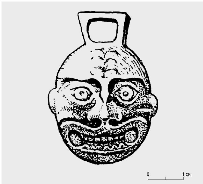
Рис. 3. Прорисовка бронзового медальона с «буддийским» изображением. Случайная находка на городище Кысмычи (Казахстан), по: Сенигова 1970: 278. Рис. 1,3

Сохранившееся левое ухо находится на уровне угла раскрытого рта. Во рту видны два ряда зубов. В местах, где кончается рот, имеется по одному округлой формы отверстию. Волосы надвинуты на брови и показаны кружками. У верхней части головы сделан подквадратной формы выступ с отверстием, для шнура. Судя по общему облику изображенного, можно предположить, что перед нами один из религиозных персонажей буддийской иконографии. Ибо, согласно религиозным догматам буддизма, главный бог Будда всегда должен быть окружен менее значительными богами-помощниками, которых насчитывалось более тысячи. Очевидно, один из таких богов-помощников, неистовый страж, истребляющий «еретиков и безбожников», и изображен на медальоне» 25 . Наследие Т.Н.Сениговой остается крайне востребованным и сегодня.