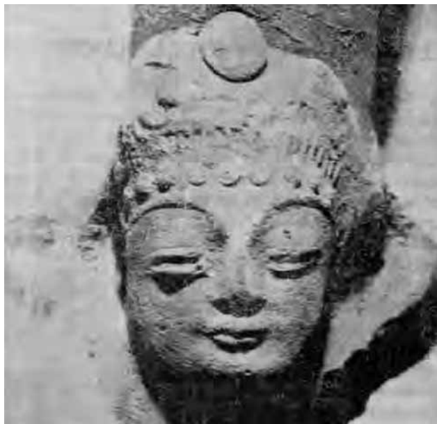
Фото 2. Буддийское портретное изображение на ручке сосуда из городища на р. Сокулук (Кыргызстан), по: Бернштам 1947: 50, рис. 33

с буддийским штампованным наделом из Сокулука VI–VII вв., по-видимому, слишком ранняя, в том числе и потому, что Сюаньцзан не обнаружил следов буддизма в 630 г. в Чуйской долине 15 . По нашему мнению, наиболее вероятно датировка этого сосуда: концом VII – первой половиной VIII вв. и была связана с китайской экспансией, в регион, в частности в Чуйскую и Таласскую долины до 751 г.